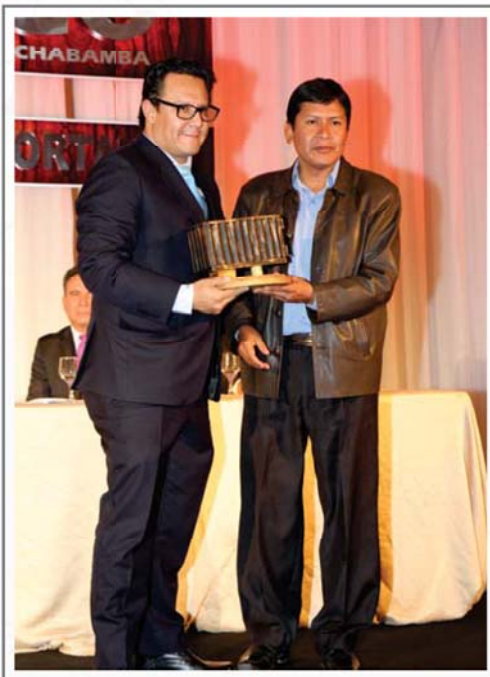
VIDRIO LUX S.A. PRIMER LUGAR SECTOR ENVASES Y EMBALAJES