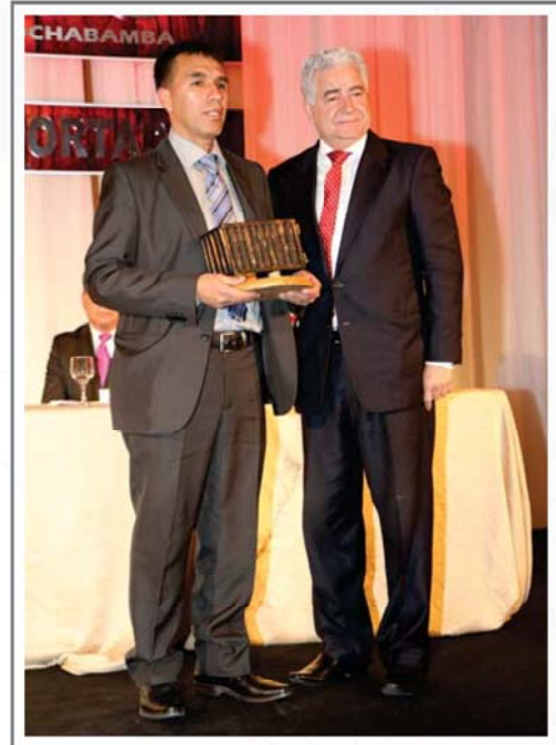
COBOCE S.R.L. PRIMER LUGAR SECTOR PIEDRA, CEMENTO Y CERÁMICA