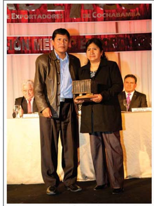
ASOCIACIÓN MINKHA SEGUNDO LUGAR SECTOR TEXTILES Y TEJIDOS