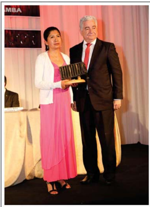
PHOCOS LATIN AMÉRICA S.R.L. PRIMER LUGAR SECTOR VARIOS