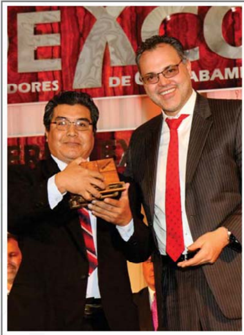
20 AÑOS DE AFILIACION A CADEXCO LIBROS ANDINOS S.A.