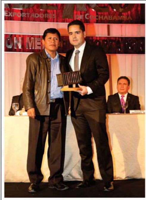
PIL ANDINA S.A. PRIMER LUGAR SECTOR ALIMENTICIO