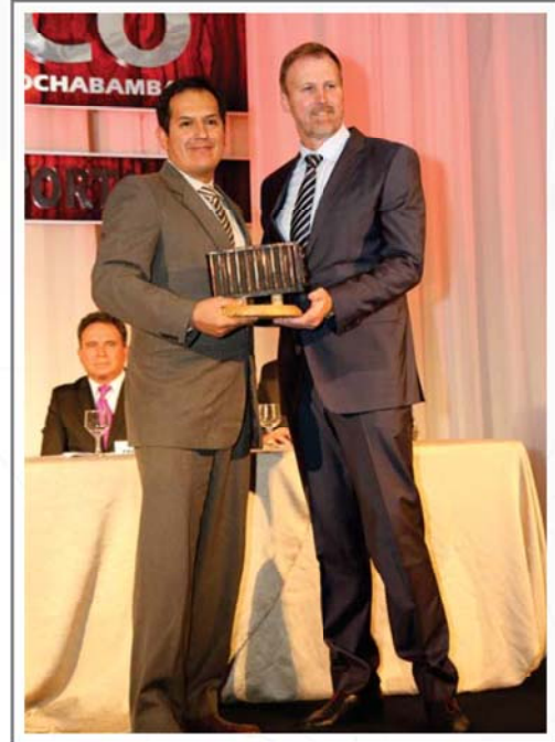
URS S.A. SEGUNDO LUGAR SECTOR SERVICIOS