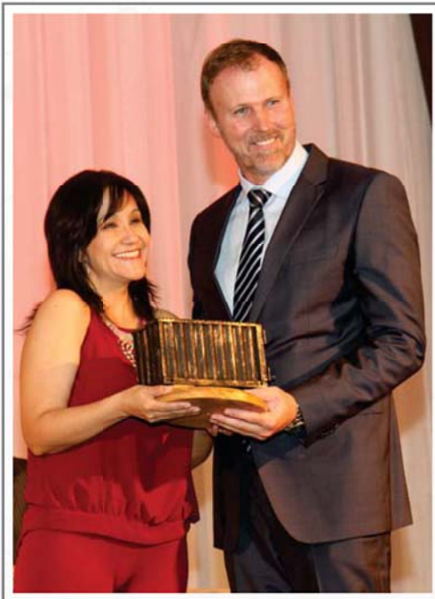
NATURALEZA S.A. PRIMER LUGAR SECTOR FRUTOS FRESCOS, DESHIDRATADOS E INFUSIONES