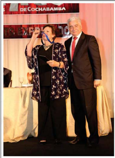
CORONILLA S.A MEDALLA DE PLATA