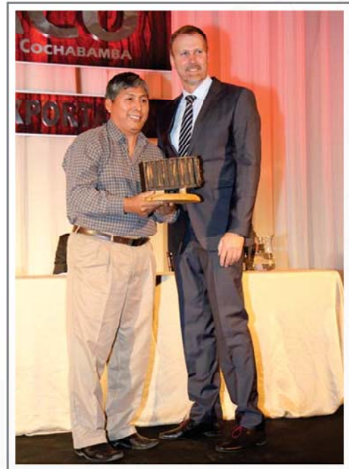
PSI LTDA. SEGUNDO LUGAR SECTOR ARTESANÍAS