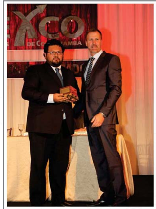
20 AÑOS DE AFILIACION A CADEXCO SOCIEDAD BIBLICA BOLIVIANA