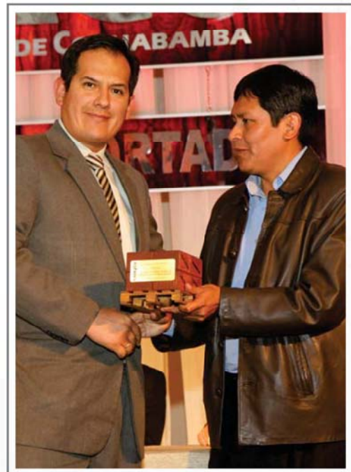
15 AÑOS DE AFILIACION A CADEXCO URS S.A.