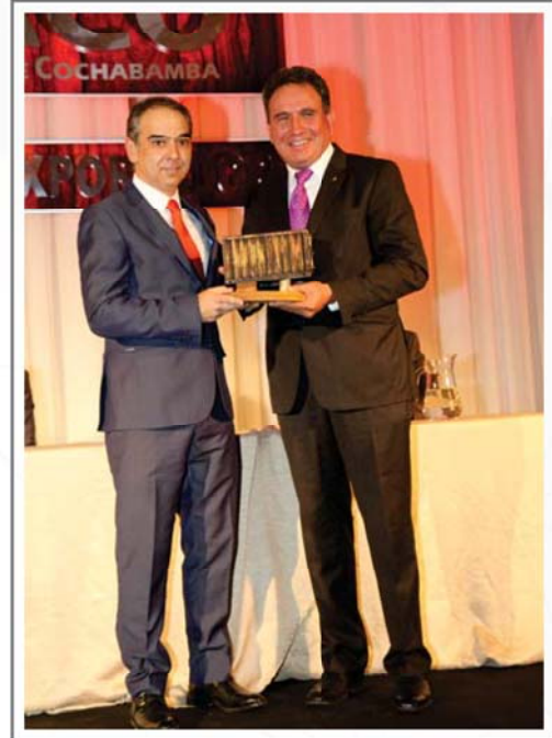
MULTIAGRO S.A. SEGUNDO LUGAR SECTOR MANUFACTURAS DE MADERA