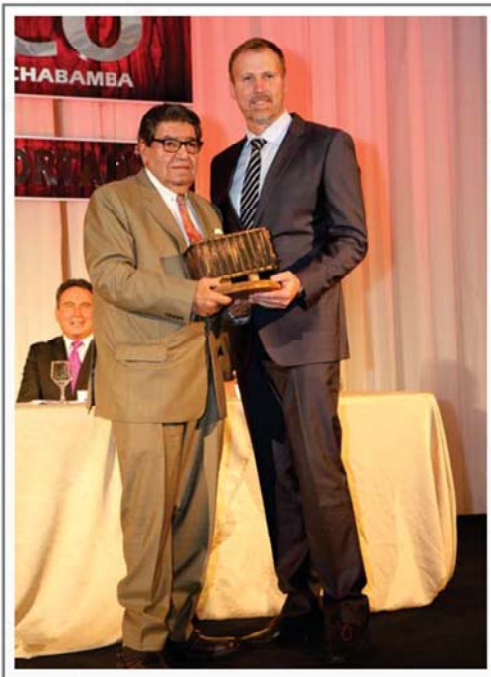
CARBOGAS PRODUCTOS INNOVADOR DE EXORTACIÓN GAS CARBÓNICO