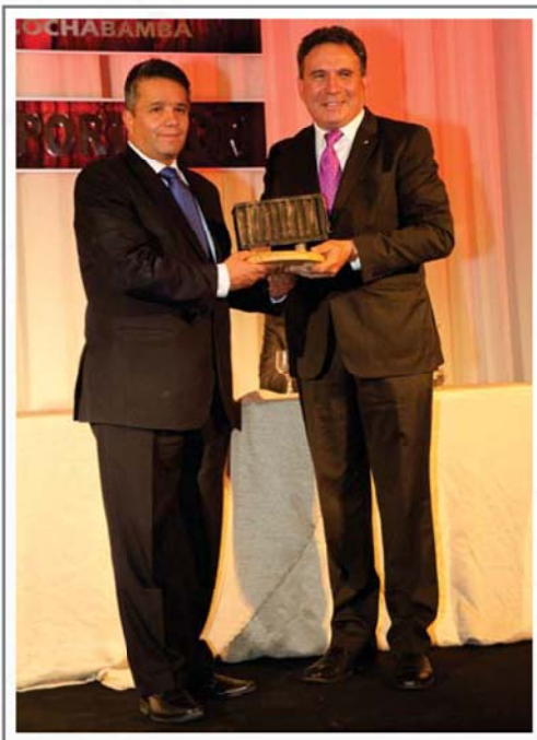
MAXAM FANEXA S.A.M. PRIMER LUGAR SECTOR PRODUCTOS DE LA INDUSTRIA QUÍMICA Y DERIVADOS