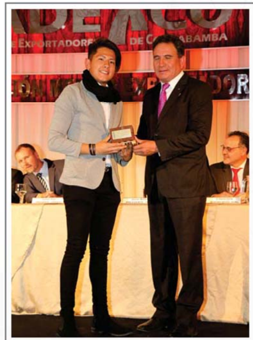
35 AÑOS DE AFILIACION A CADEXCO ARTESANIAS MERINO