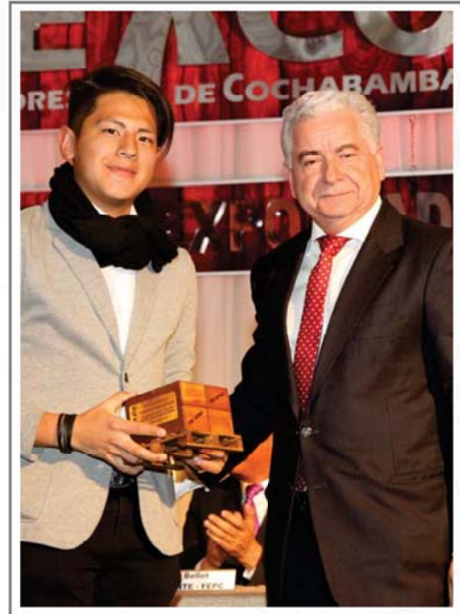
5 AÑOS DE AFILIACION A CADEXCO THOMSON REUTERS BOLIVIA S.R.L.