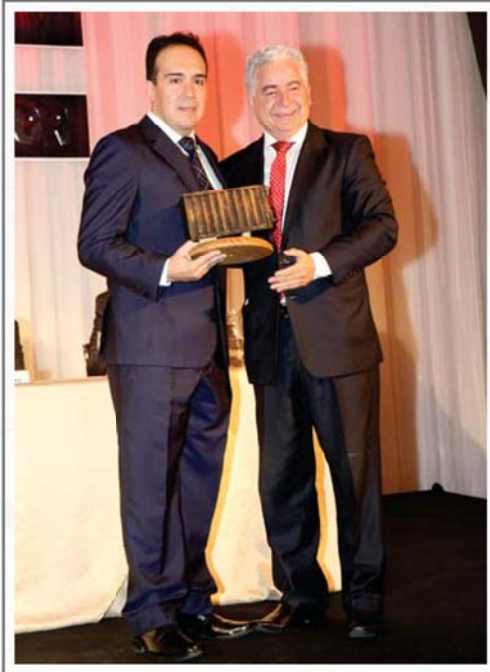
UTD LTDA. PRIMER LUGAR SECTOR MANUFACTURAS DE MADERA