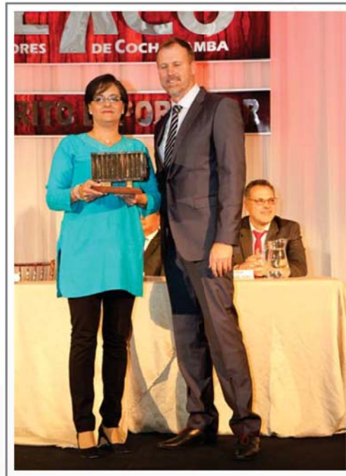
PUENTE DE SOLIDARIDAD INTERNACIONAL GALARDON EN RESPONSABILIDAD SOCIAL EMPRESARIAL