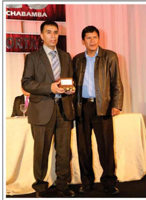
COBOCE CERÁMICA LTDA. MAYOR CRECIMIENTO ABSOLUTO