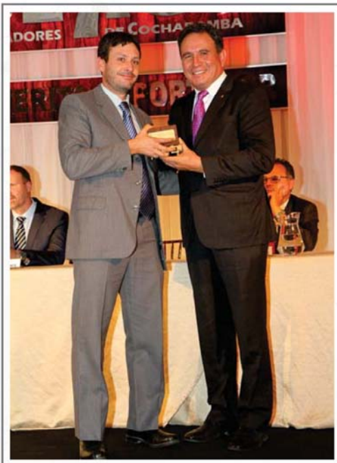
10 AÑOS DE AFILIACION A CADEXCO AGROINDUSTRIAS DE LA SELVA