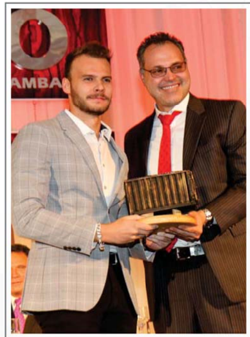
DIESE LTDA. PRIMER LUGAR SECTOR MINERALES NO METÁLICOS