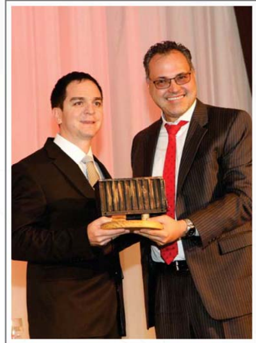
CORONILLA S.A. SEGUNDO LUGAR SECTOR ALIMENTICIO