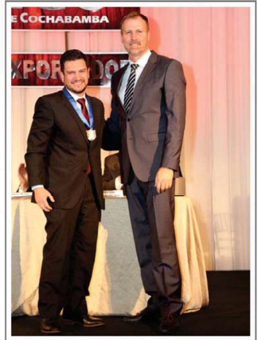
PIL ANDINA MEDALLA DE ORO