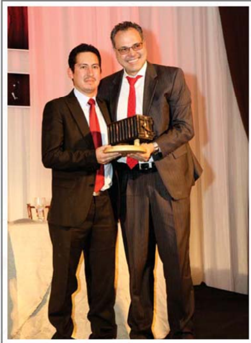
PISABOL S.R.L. MAYOR CRECIMIENTO RELATIVO