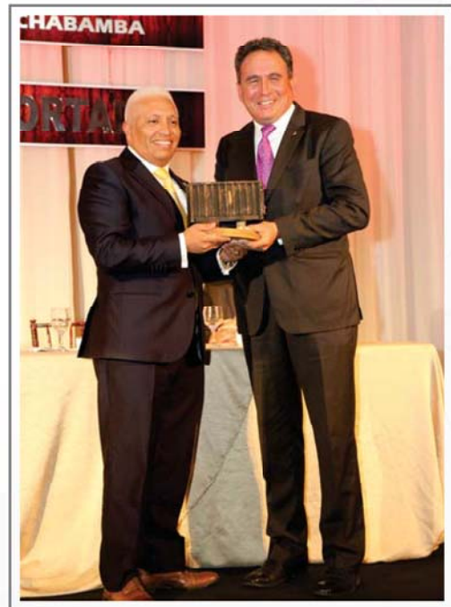
TECNOLOGÍA PAZ ROJAS S.A. SEGUNDO LUGAR SECTOR VARIOS