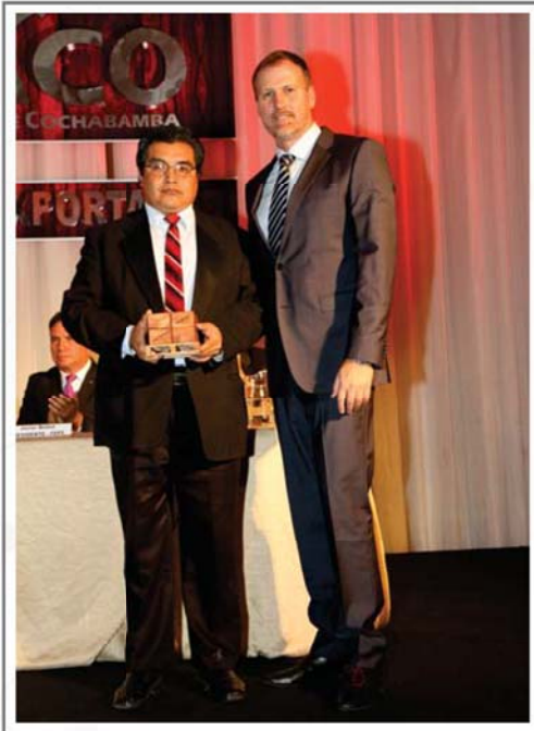
5 AÑOS DE AFILIACION A CADEXCO SUD LIBROS