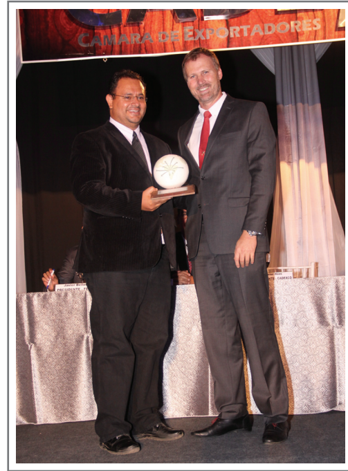
VIDRIO LUX S.A. SEGUNDO LUGAR SECTOR ENBACES Y EMBALAJES