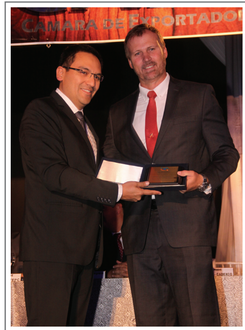
CÁMARA DE COMERCIO Y SERVICIOS DE COCHABAMBA