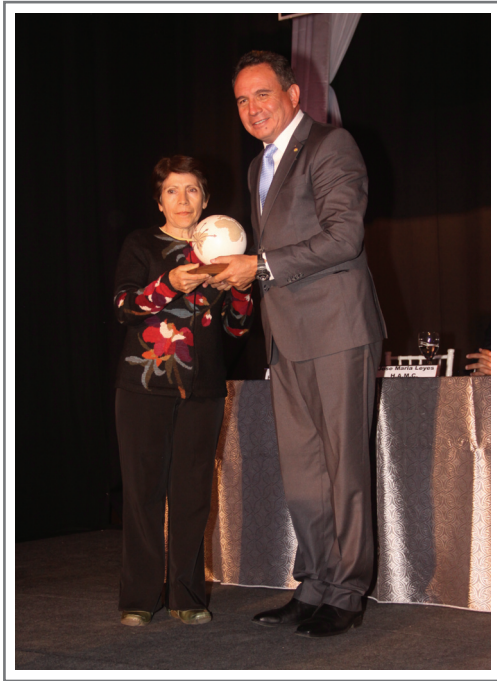
COLORS TOUCH S.R.L. PRIMER LUGAR SECTOR TEXTILES Y TEJIDOS