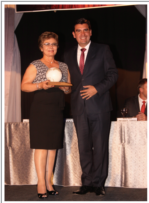
JUÁREZ GUZMÁN S.R.L. PRIMER LUGAR SECTOR MINERALES NO METALICOS