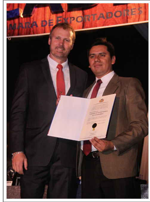
BRIGADA PARLAMENTARIA DE COCHABAMBA