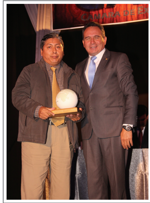
PUENTE DE SOLIDARIDAD INTERNACIONAL SEGUNDO LUGAR SECTOR ARTESANIAS