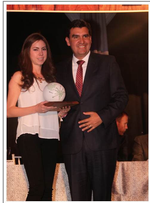
URS S.A. SEGUNDO LUGAR SECTOR SERVICIOS