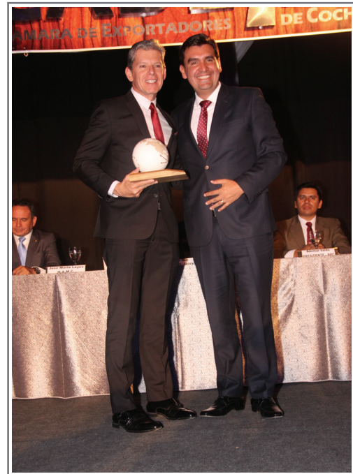
MÉRITO EXPORTADOR FUNDACION PARA LA FERIA INTERNACIONAL DE COCHABAMBA