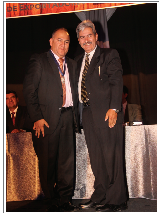
MEDALLA DE PLATA MAXAM FANEXA S.A.M