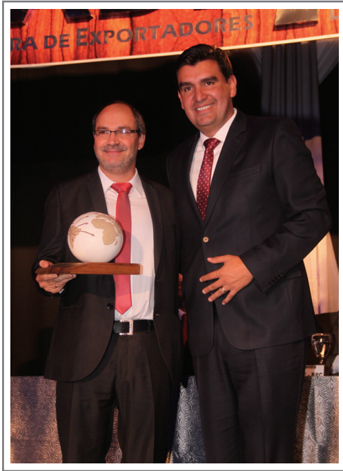
PIL ANDINA S.A. PRIMER LUGAR SECTOR ALIMENTOS