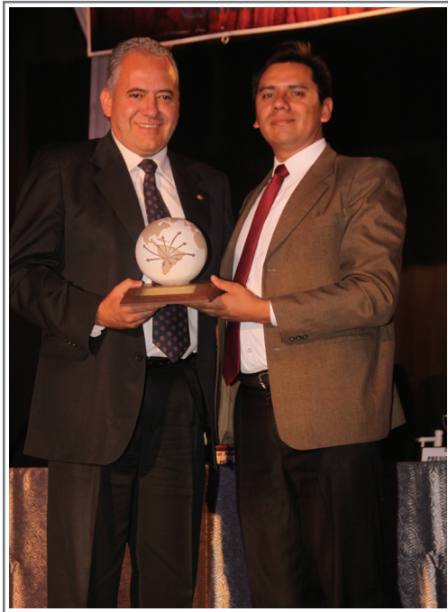
MÉRITO EXPORTADOR FUNDACIÓN HECHO EN BOLIVIA