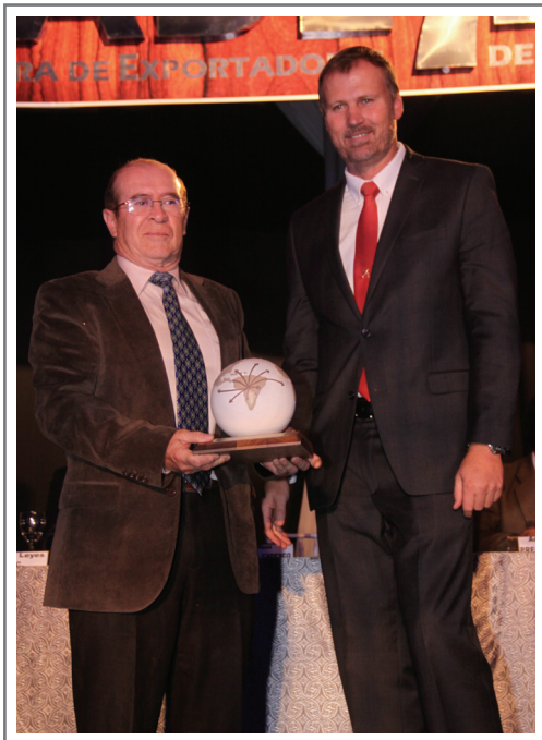
MAXAM FANEXA S.A.M. PRIMER LUGAR SECTOR INDUSTRIA QUÍMICA Y DERIVADOS