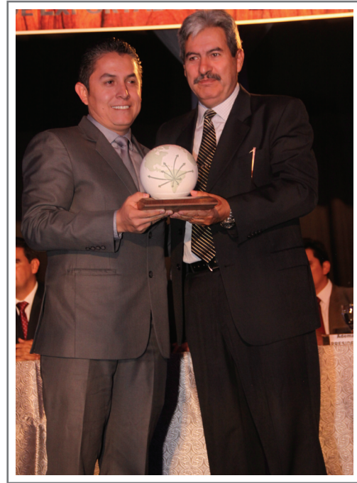
CERÁMICA FABOCE S.R.L. SEGUNDO LUGAR SECTOR MANUFACTURAS DE PIEDRA, CEMENTO Y CERÁMICA