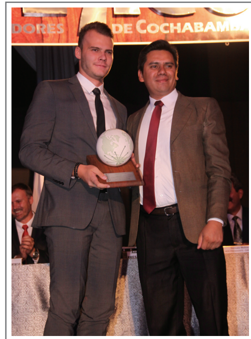
DIESS LTDA. SEGUNDO LUGAR SECTOR MINERALES NO METALICOS