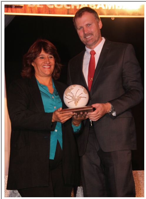
NATURALEZA S.A. PRIMER LUGAR SECTOR FRUTOS FRESCOS, DESHIDRATADOS E INFUSIONES