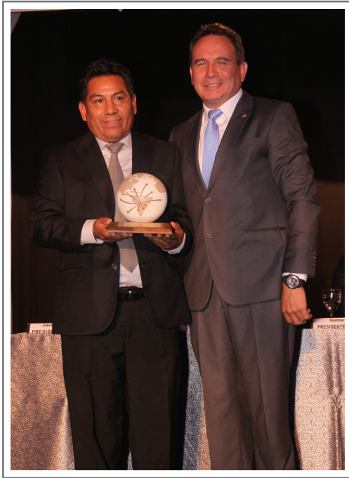
CERÁMICA COBOCE LTDA. PRIMER LUGAR SECTOR MANUFACTURAS DE PIEDRA, CEMENTO Y CERÁMICA