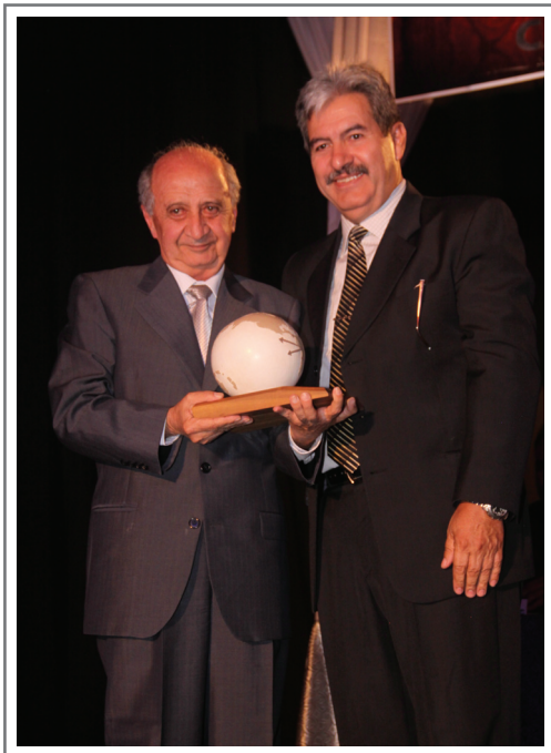
SEFO S.A.M. PRIMER LUGAR SECTOR PLANTAS, SEMILLAS Y AFINES