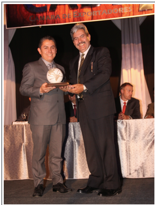
MÉRITO EXPORTADOR PRODUCTO INNOVADOR DE EXPORTACIÓN "TECNOGRANITO" FABOCE S.R.L.