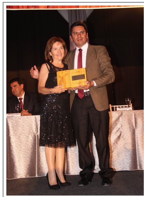
15 AÑOS DE AFILIACION A CADEXCO SILVER CRAFT S.R.L.