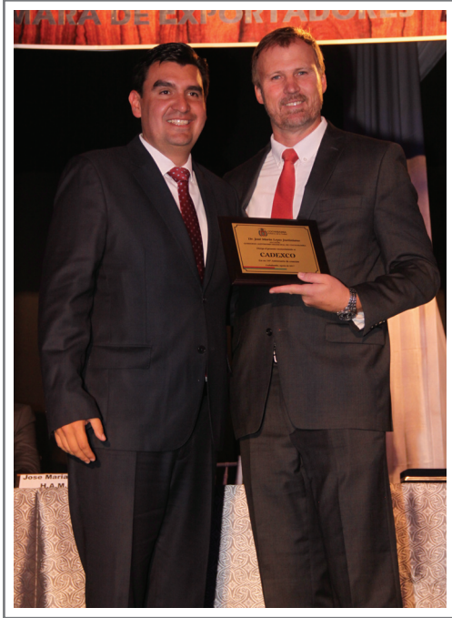
HONORABLE ALCALDIA MUNICIPAL DE COCHABAMBA

Instituciones reconocen a CADEXCO por su trigésimo cuarto año de fundación y trabajo a favor del sector empresarial exportador.