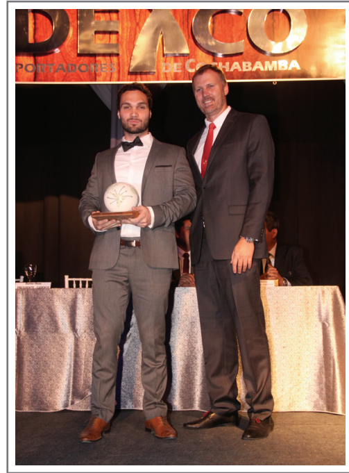
CORONILLA S.A. SEGUNDO LUGAR SECTOR ALIMENTOS