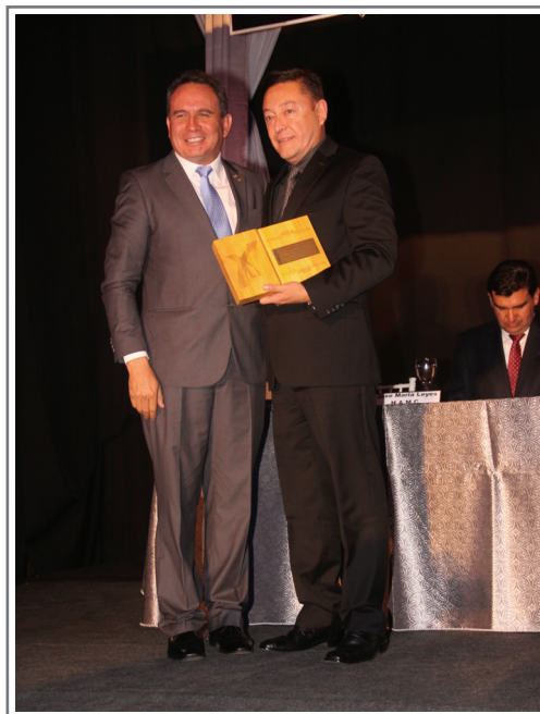
MÉRITO EXPORTADOR CRECIMIENTO EN VALOR ABSOLUTO PIL ANINA S.A.