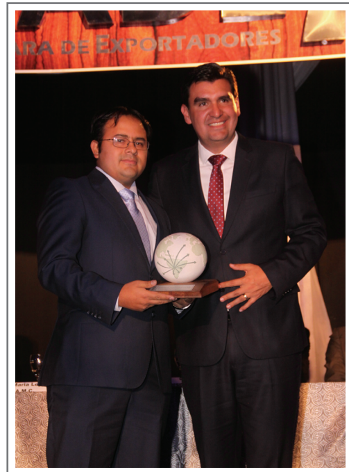
UNILEVER ANDINA S.A. SEGUNDO LUGAR SECTOR INDUSTRIA QUÍMICA Y DERIVADOS