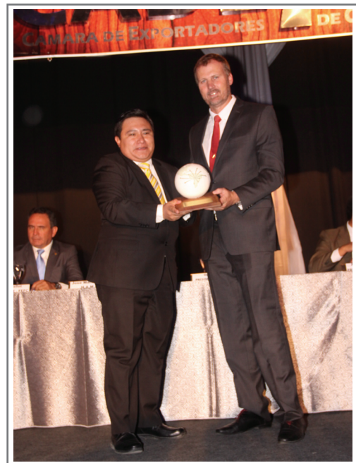
MÉRITO EXPORTADOR A LA RESPONSABILIDAD SOCIAL EMPRESARIAL CERAMICA COBOCE LTDA