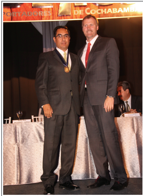
MEDALLA DE ORO PIL ANDINA S.A.