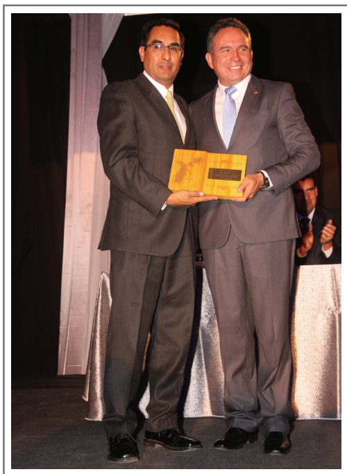
20 AÑOS DE AFILIACION A CADEXCO PIL ANDINA S.A.